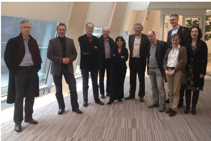
De Begeleidingscommissie op bezoek bij het RCE.